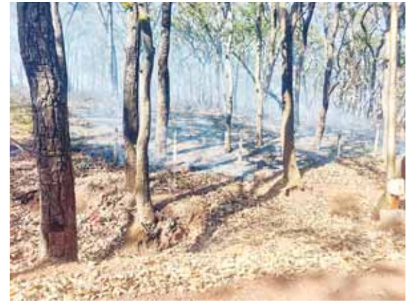
राह आग कब बुझेगी